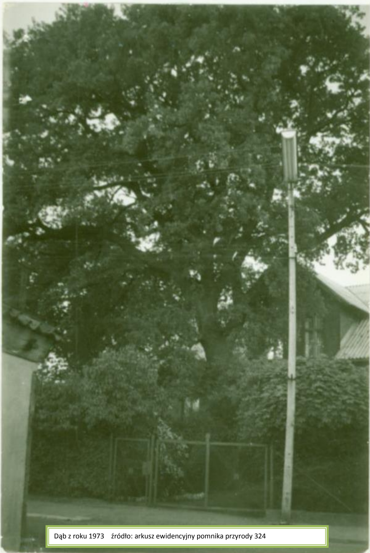
Dąb z roku 1973